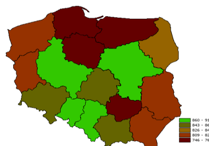
Udział w handlu wewnętrznym UE28 (%) w 2017